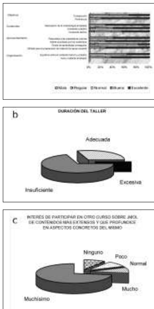
Figura 3. Evaluación del taller según contestación al cuestionario/encuesta

miento cada uno de los apartados descritos en el programa. Por todo ello, y como refleja la encuesta realizada, así como la opinión verbalmente expresada por los participantes en este taller, hay un interés general en realizar otro curso sobre Jmol con mayor extensión de sus contenidos y que profundice en aspectos concretos de este programa.